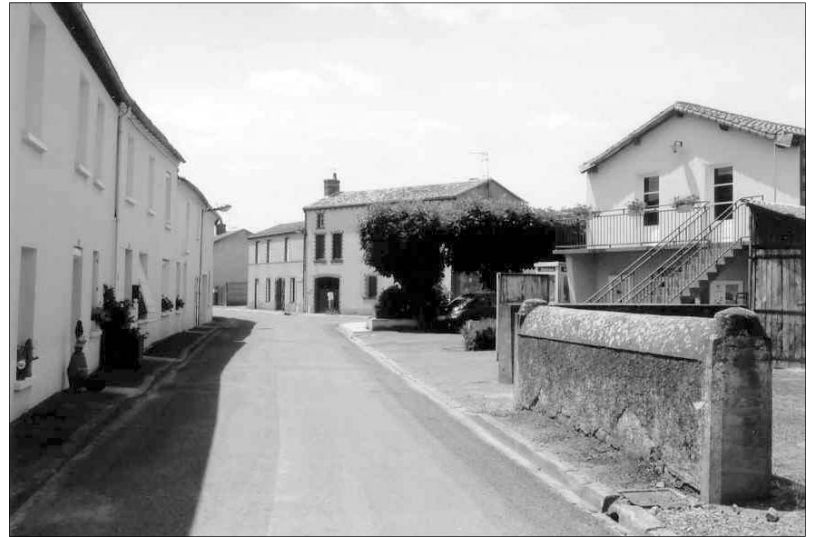
Rue principale d'Étusson.