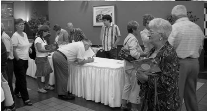
Accueil, chaleureux, échanges.