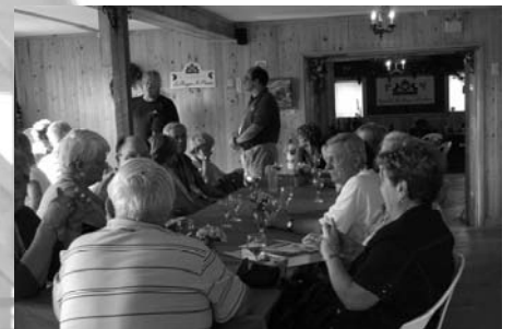
Dégustation de bons vins.