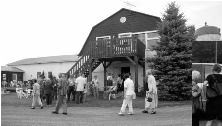
Arrivée au vignoble Le Royer St-Pierre.