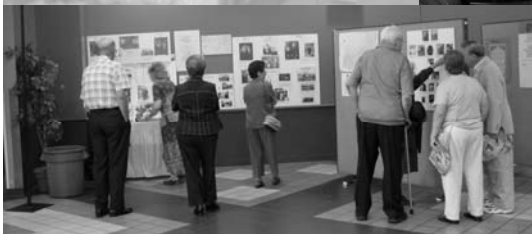
Expositions de photos familiales, de recherches.