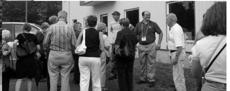
Départ de la visite de la ferme Delfland.