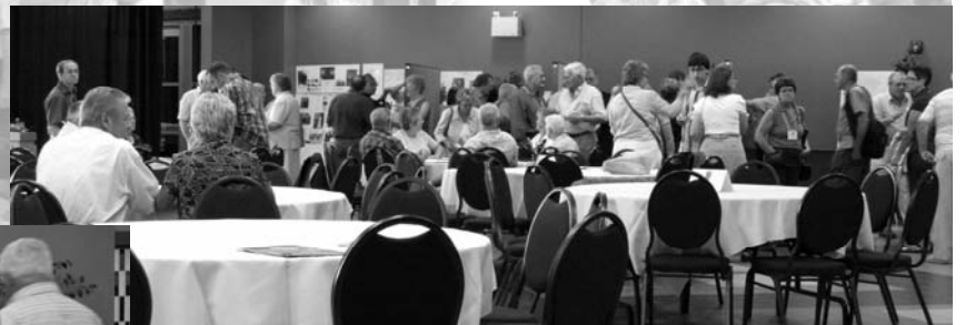
Les petits cousins échangent, partagent, placotent.